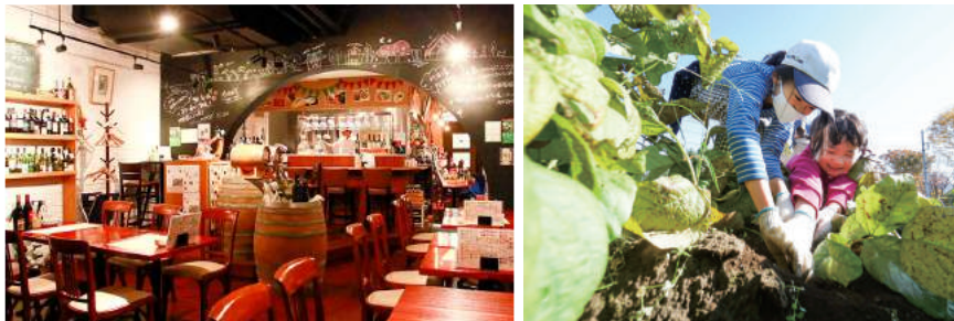
30 農家のくにたち野菜タバスが人気の「くにたち村酒場」 収穫を楽しむ親子向けの農業体験イベントの様子