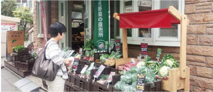
2011 年開業の「くにたち野菜 しゅんかしゅんか」

一貫しているのは、「つくる人と食べる人の橋渡しを通じて、街と農業を元気にしていくこと」。エマリコくにたちは、小さな直売所を運営するベンチャー企業から、東京産農産物流通のリーディングカンパニーへと飛躍を目指しています。